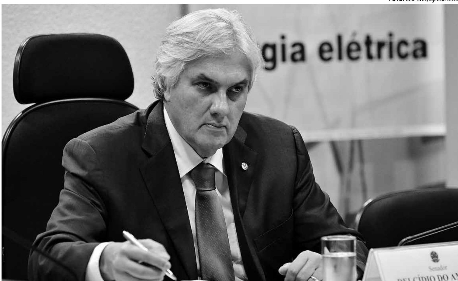
O senador Delcídio Amaral foi preso pela Polícia Federal, acusado de tentar obstruir as investigações da Operação Lava Jato

"Tendo o caso sido julgado, propicia-se nova apreciação das medidas cautelares (aplicadas pelo STF), já que há alteração da situação processual do caso e o que era imperativo naquele momento, no presente é passível de algumas alterações. Resolvo alterar parcialmente as medidas cautelares, especificamente o recolhimento domiciliar com tornezeleira eletrônica. Apesar da medida ser imprescindível antes do julgamento, como entendeu o Supremo, entendo que no presente momento, prolatada a sentença, não se faz ela mais conveniente".