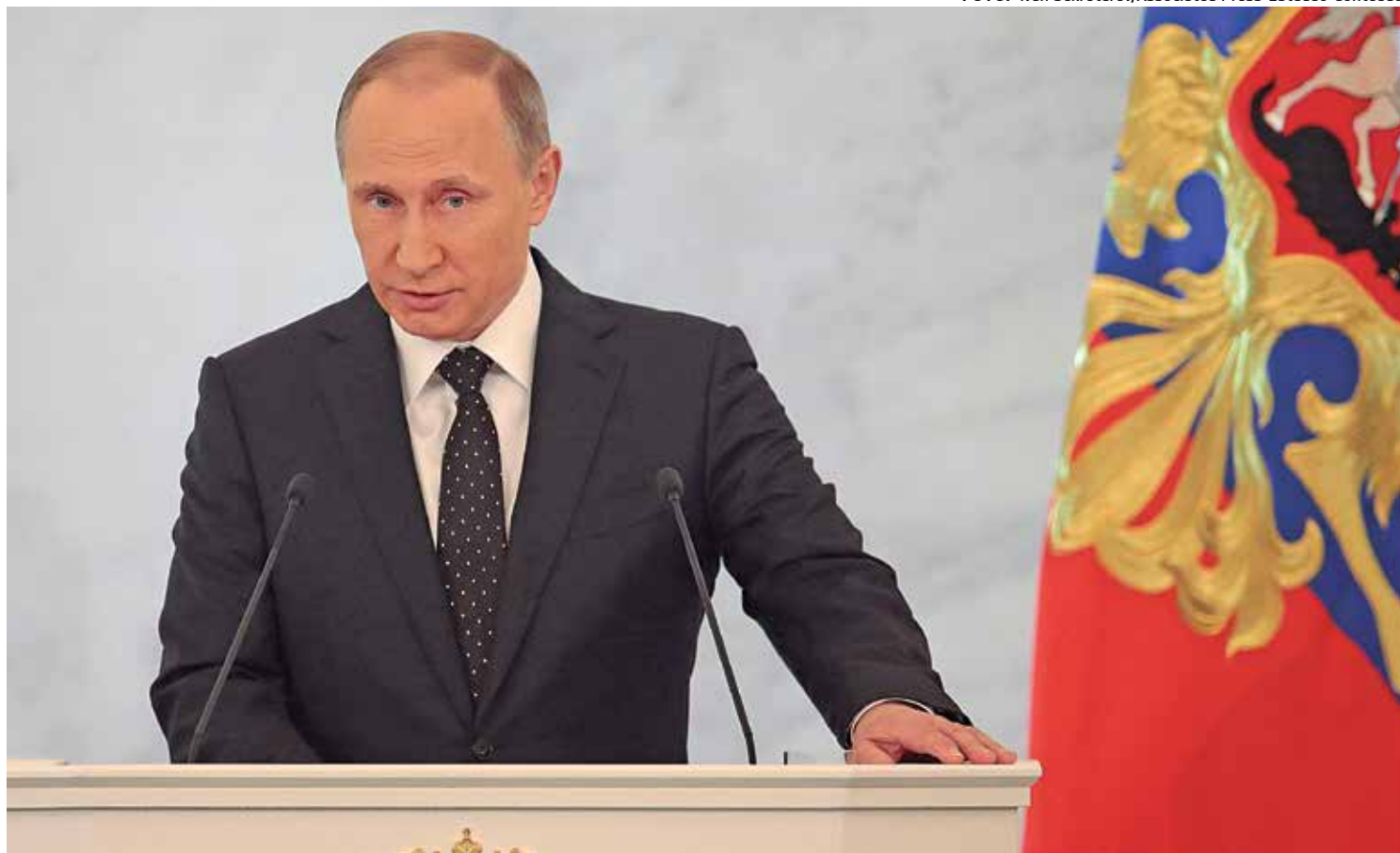
Vladimir Putin acusou o presidente turco de financiar o Estado Islâmico através de compras de petróleo de poços sob o seu controle

Entre as organizações que participam da aliança está a União Internacional de Arquitetos, que representa, por meio de organizações nacionais, perto de 1,3 milhão de arquitetos em todo o mundo; o World Green Building Council, que representa 27 mil empresas de construção civil e fomenta o mercado de edifícios sustentáveis; a Royal Institution of Chartered Surveyors, que representa 180 mil inspetores de construção em nível mundial; e a Federação Europeia da Indústria da Construção, que representa as empresas do setor de construção por meio de 33 federações nacionais em 29 países.