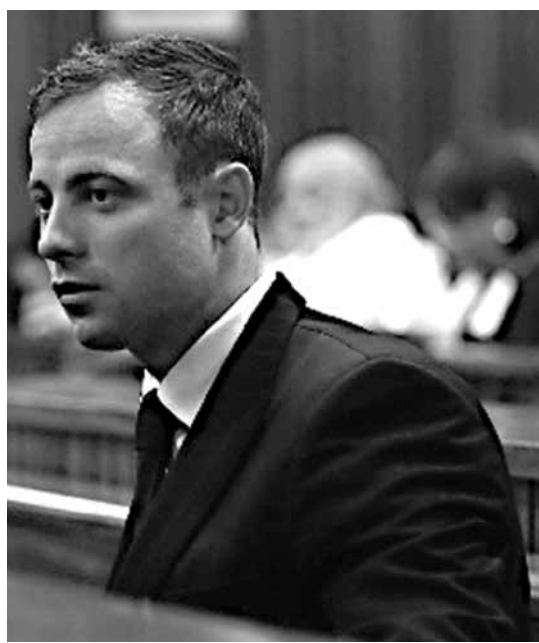
O paratleta Oscar Pistorius aguarda a sentença

O sul-africano, dono de oito medalhas paraolímpicas (seis de ouro) no atletismo, vive atualmente em prisão domiciliar na casa de um tio, em Pretória. O atleta chegou a cumprir pena na cadeia, mas recebeu autorização para deixá-la em menos de um ano. Ainda não foi divulgado se o sul-africano será imediatamente encaminhado à cadeia ou se aguardará em casa a determinação da pena.