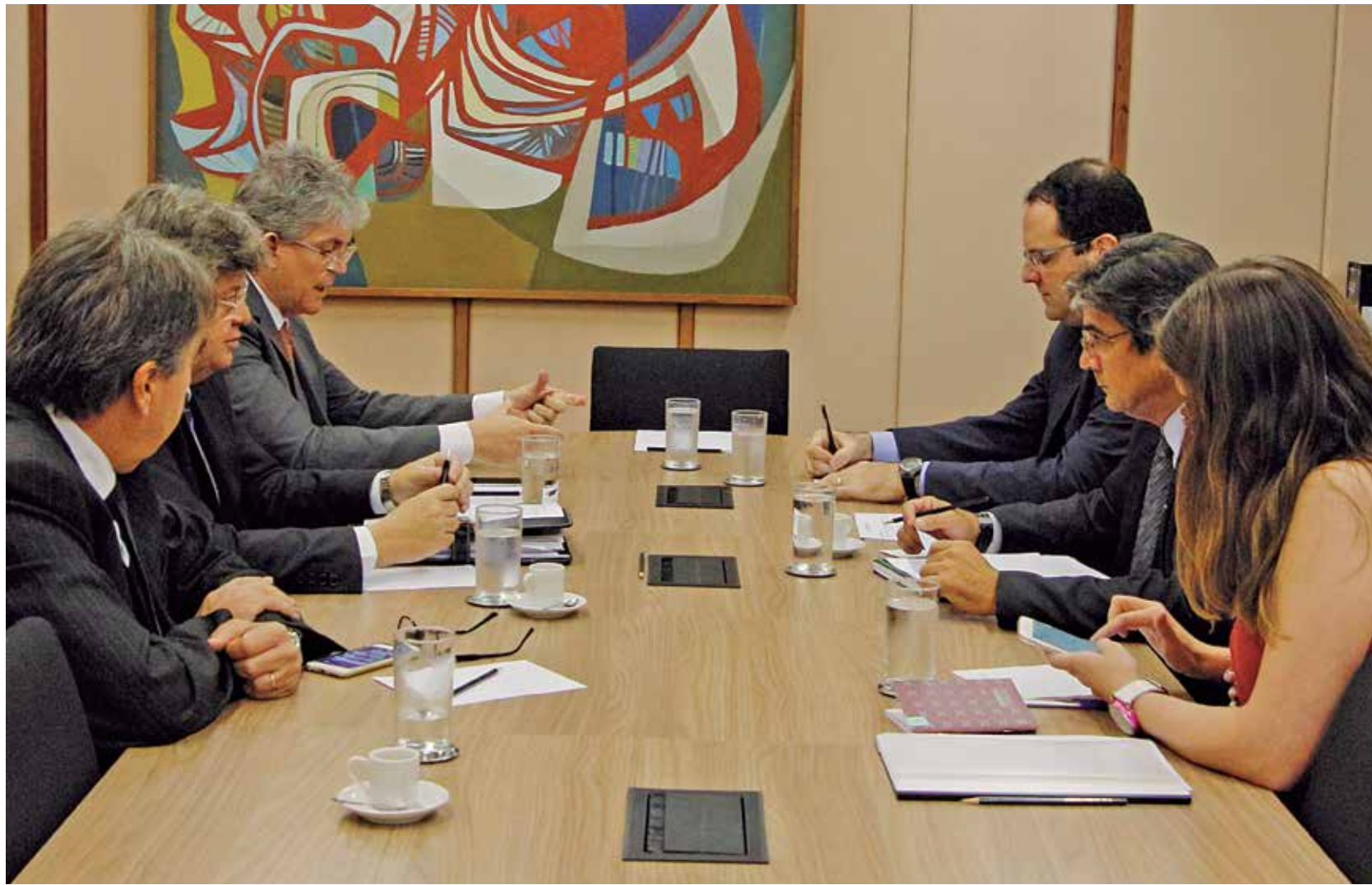
Reunião em Brasília teve o objetivo de apresentar a documentação definida no último encontro com a presidente Dilma Rousseff