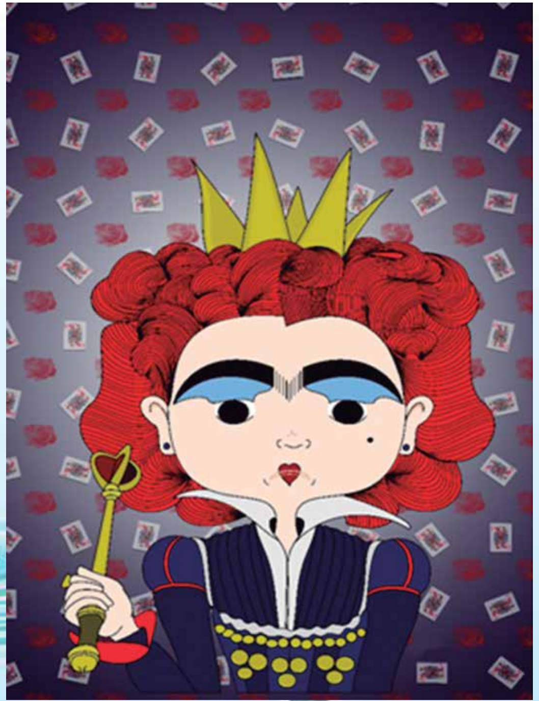
Intituladas "Frida Cisne Negro Kahlo" (E) e "Frida de Copas (D)", as telas compõem a exposição da artista paraibana inspirada na pintora mexicana Frida Kahlo