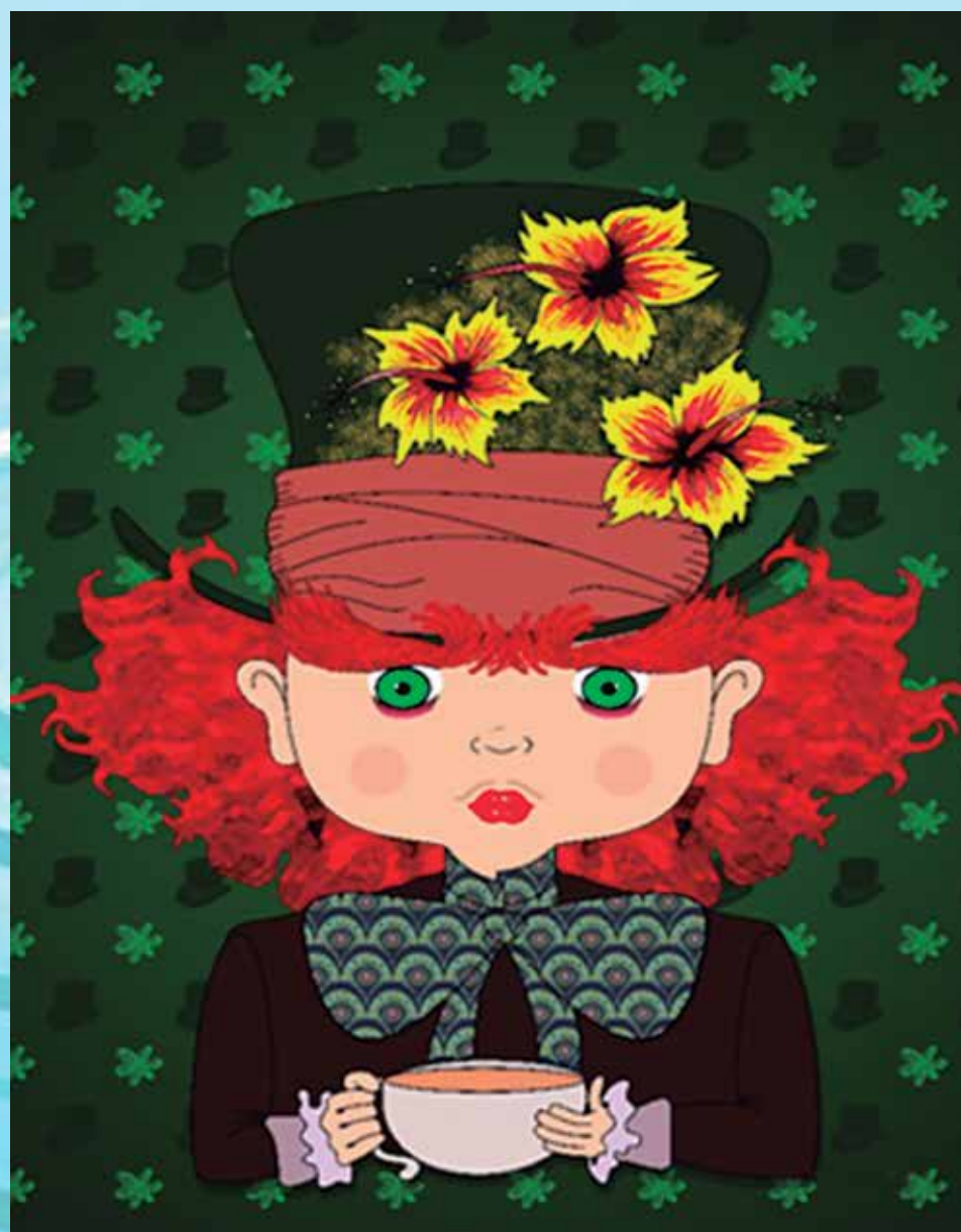
Os quadros também homenageiam ícones do cinema atual e clássico

Entre os quadros em tela com chassi que serão expostos a partir do dia 4 de dezembro estão as obras intituladas "Laranja Kahlo", que faz referência ao filme Laranja Mecânica, produzido e dirigido por Stanley Kubrick em 1971;