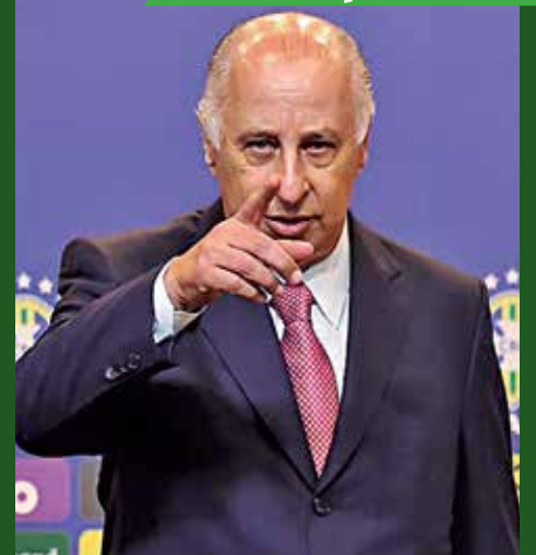
Presidente da CBF, Marco Polo Del Nero