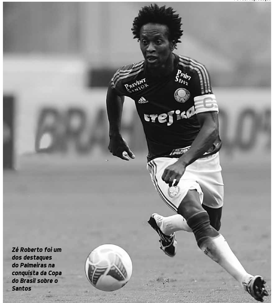
Zé Roberto foi um dos destaques do Palmeiras na conquista da Copa do Brasil sobre o Santos

O Palmeiras ainda fará uma partida antes do fim da temporada de 2015. O time comandado por Marcelo Oliveira encerra sua participação no Campeonato Brasileiro domingo, às 17h (de Brasília), contra o Flamengo, no Maracanã.