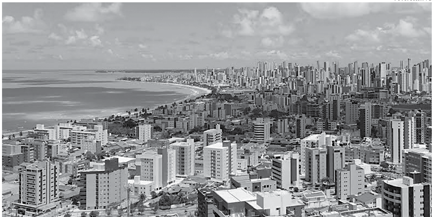
Em João Pessoa, os bairros de Tambaú, Manaíra, Cabo Branco, Altiplano e Miramar já contam com a rede de distribuição do gás natural

São 260 edifícios e 168 estabelecimentos comerciais em João Pessoa e Campina Grande ligados ao gás natural, que serve como combustível para o