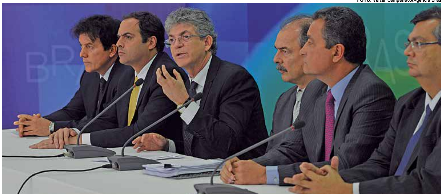
Governador da Paraíba destacou que a democracia brasileira não pode ser refém de "chantagem de qualquer natureza"

A nota é assinada pelos governadores Ricardo Coutinho (Paraíba), Camilo Santana (Ceará), Flávio Dino (Maranhão), Jackson Barreto (Sergipe), Paulo Câmara (Pernambuco), Renan Filho (Alagoas), Robinson Faria (Rio Grande do Norte), Rui Costa (Bahia) e Wellington Dias (Piauí). (Com informações do Blog do Planalto)