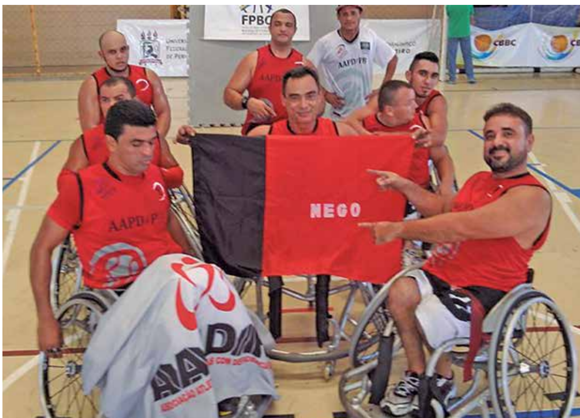
Equipe paraibana ergue com orgulho bandeira do Estado após conquistar em Recife o título do Campeonato Brasileiro, trazendo na bagagem o troféu de campeão

Ginásio lotado, muito nordestinos, alguns apoiando a equipe paraibana, o que